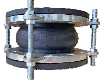
橡胶软接头 B2005/B2006/B2007-...系列 法兰连接 PN16、PN25